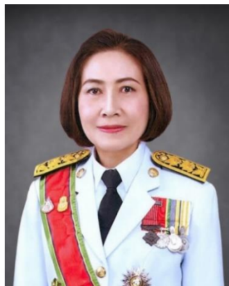
นางมารศรี ใจรังษี เลขาธิการสำนักงานประกันสังคม